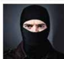
Preventing Fraud & Cheating Very difficult to cheat through secure digital 96LC RS 485 communication