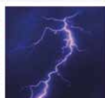
Lightning & Surge Voltage Protection Standard use with LPK24 Protection & Power Supply Kit for 100-240VAC models