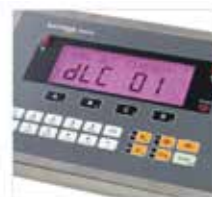
Lowest Service Costs Easy and quick fault finding, detects problems and simplifies service