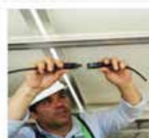
Quick Service After load cell change, use without re-calibration for non-legal for trade scales