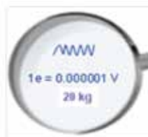
Highest Accuracy Higher sensitivity than analog load cells with in-built hybrid processor