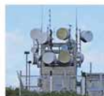
Eliminated Spoiling Influences Operation Temperature & Voltage variation, Radio and Electromagnetic effects