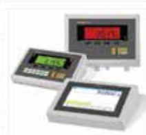
Advanced Weighing Functions Operates with intelligent European/OIML approved BAYKON weight indicator or terminals