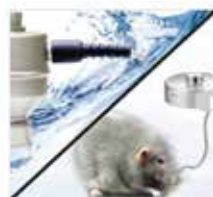
Heavy-duty And Water Resist Cables Dual core cable, creates a protective shield protected by braided stainless steel sheathing