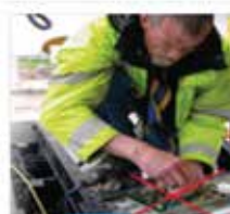
Electronic Calibration No manual corner adjustment (like trimpot, resistance etc.) in junction box and high accuracy electronic calibration (without test weights)