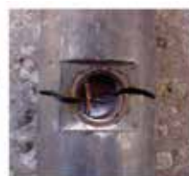
Rust & Corrosion The fully welded stainless steel structure, hermetically sealed, IP68 protection class